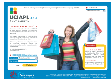
Maquette de la page d'accueil du futur site

MISE EN LIGNE DU SITE INTERNET PROGRAMMÉE LE 1ER AOUT 2005 WWW.UCIAPL.COM